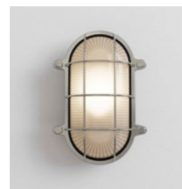
CODE: 1376004 FINISH: POLISHED NICKEL

THIS PRODUCT IS SUITABLE FOR USE BY THE COAST AND OTHER ONEROUS ENVIRONMENTS - TEN YEAR WARRANTY APPLIES, EXCEPT WHEN THE PRODUCT HAS AN INTEGRAL LED AND/OR DRIVER IN WHICH CASE, A THREE YEAR WARRANTY APPLIES. FOR FURTHER WARRANTY INFORMATION PLEASE REFER BACK TO THE ORIGINAL POINT OF PURCHASE.